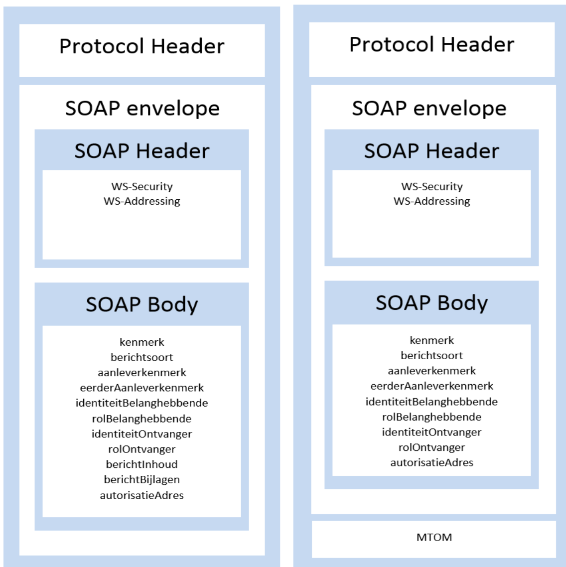
Figuur 2: SOAP Request voor de Aanleverservice (met en zonder gebruik van MTOM)

De SOAP request bevat het 'aanlever'-verzoek. In onderstaand figuur wordt de opbouw van de SOAP request getoond. Deze is afhankelijk van het al dan niet gebruiken van MTOM (berichtoptimalisatie; voor meer informatie zie het document Koppelvlakbeschrijving BIV: WUS 2.0 Bedrijven).